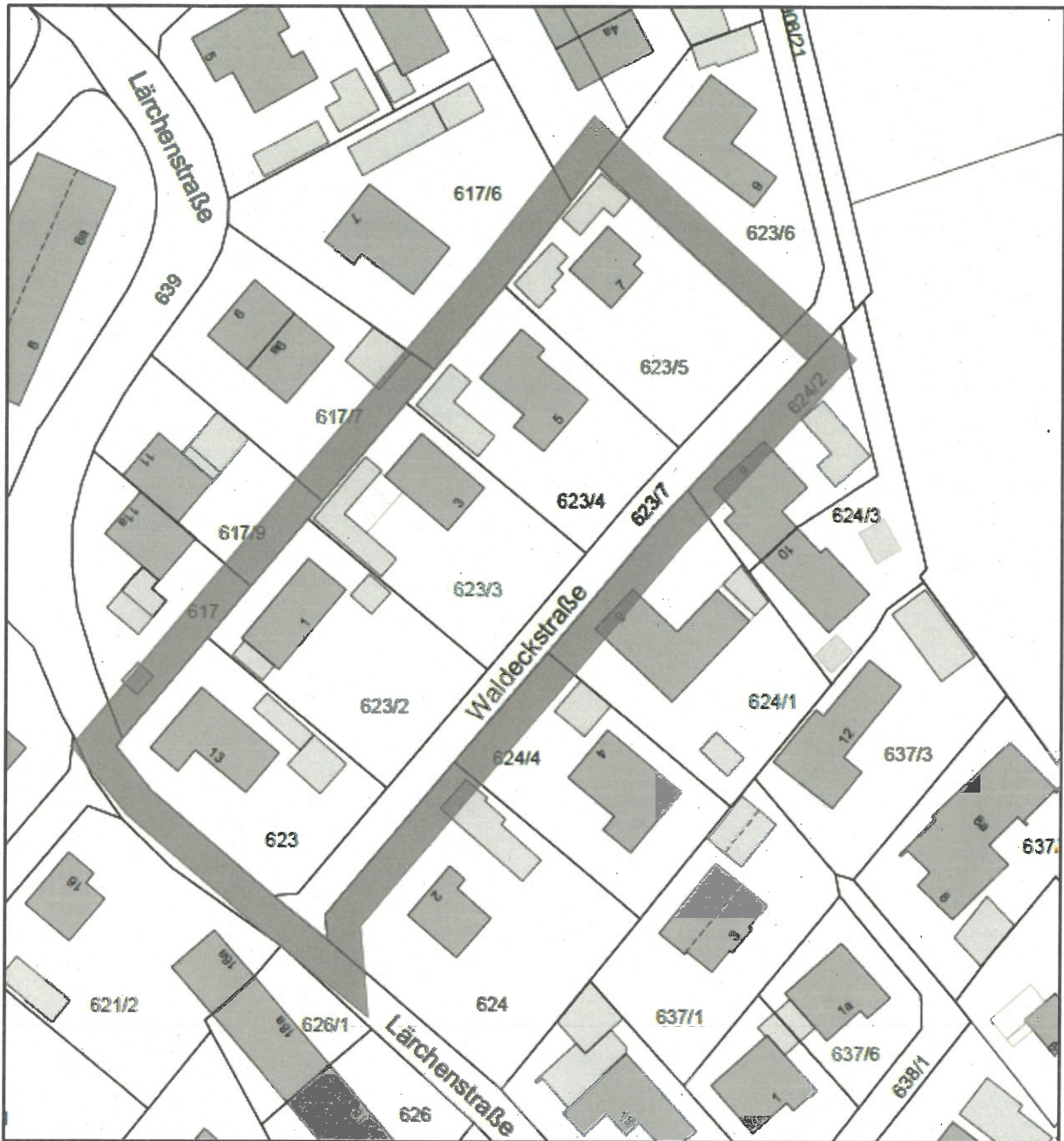
Geltungsbereich Bebauungsplan Nr. 91 „Waldeckstraße“, ohne Maßstab

Der Planentwurf besteht aus textlichen Festsetzungen und einer Begründung.